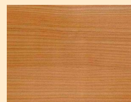
Lariks no. 110-89