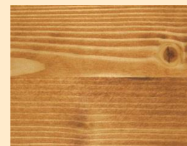
Teak no. 110-81