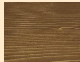
Bangkirai no. 110-85